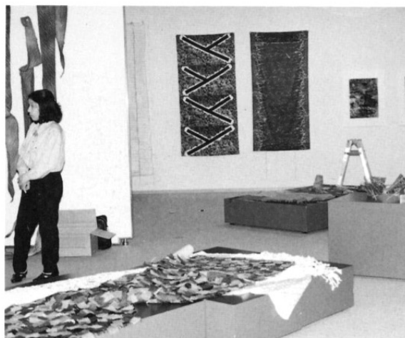
チェックする会員