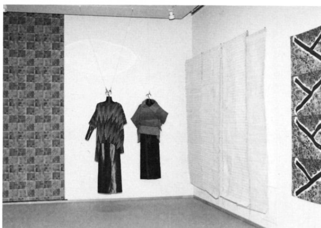
いろいろなジャンルの作品も展示