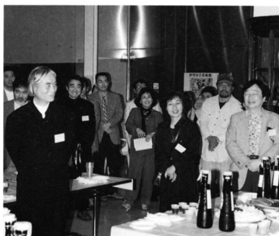
ベルギービールを飲みながらのパーティ